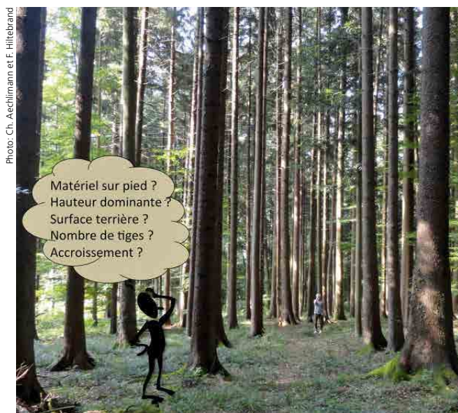
Figure 1: Photo d'une pessière prise par deux étudiants dans le cadre d'un travail d'étude autonome.